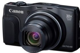
PowerShot SX710 HS