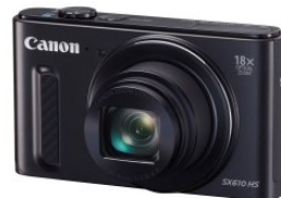
PowerShot SX610 HS