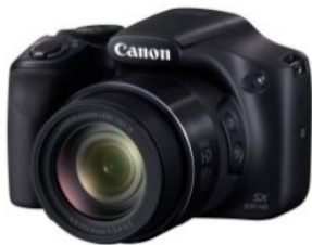
PowerShot SX530 HS