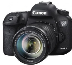
EOS 7D Mark II

Milano, 26 marzo 2015 – Per il dodicesimo anno consecutivo, Canon si conferma il leader nel mercato delle fotocamere digitali a lenti intercambiabili 1 in termini di numero di unità vendute nel mondo.