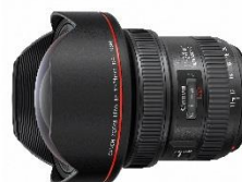
EF 11-24mm f/4L USM