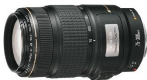
EF 75-300mm f/4-5.6 IS USM