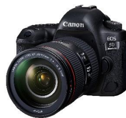
EOS 5D Mark IV

Distribuita in Giappone nel settembre 2003