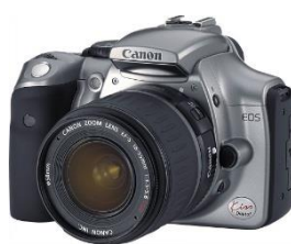
EOS Kiss Digital

Distribuita in Giappone nel settembre 1989