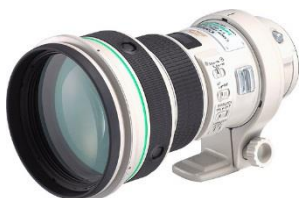
EF 400mm f/4 DO IS USM