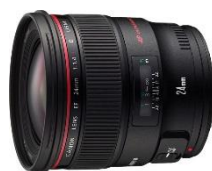
EF 24mm f/1.4L II USM